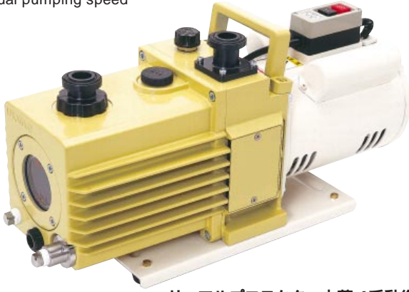
サーマルプロテクター内蔵 (手動復帰) With built-in thermal protector