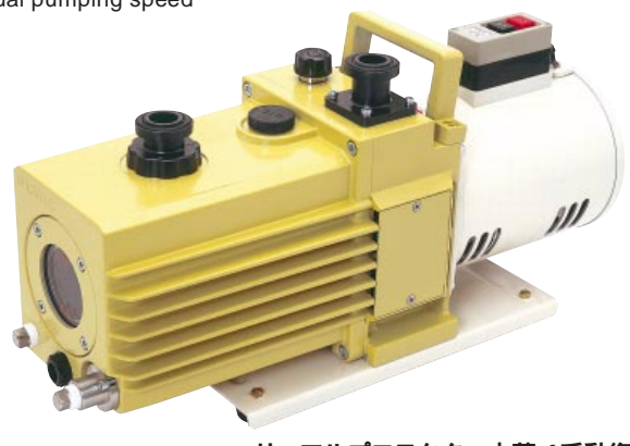
サーマルプロテクター内蔵 (手動復帰) With built-in thermal protector