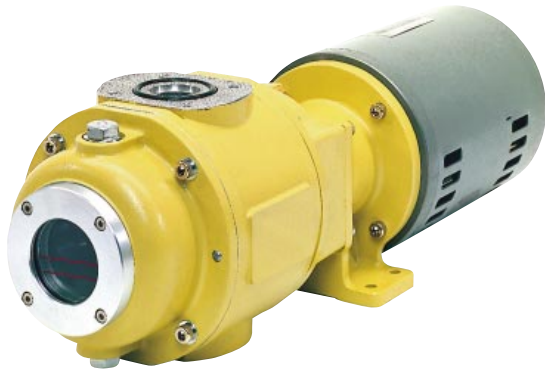
サーマルプロテクター内蔵 (100Vのみ) With built-in thermal protector