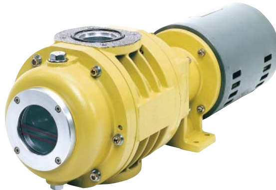
サーマルプロテクター内蔵 (100Vのみ) With built-in thermal protector